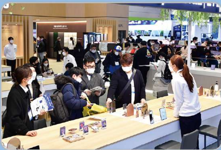
오프라인 대표 전자·IT전시회 KES